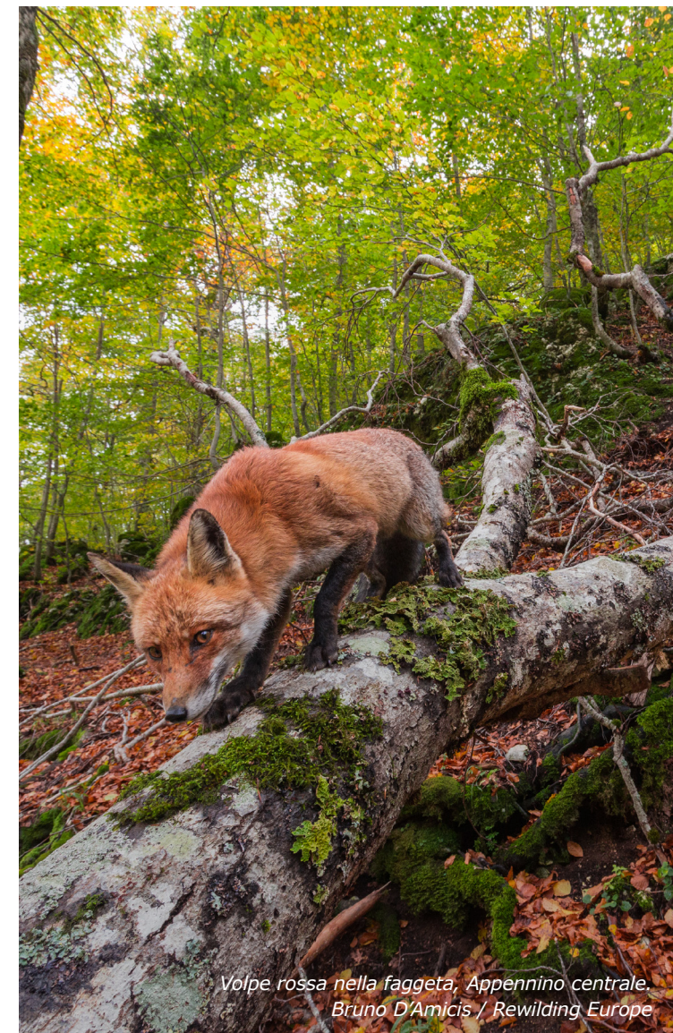
Volpe rossa nella faggeta, Appennino centrale.