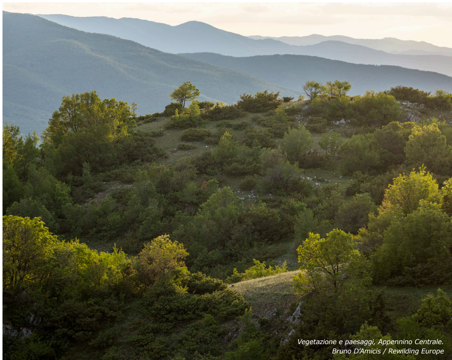
Vegetazione e paesaggi, Appennino Centrale.

Sia i privati che le persone giuridiche possono proporre a Governo e Regioni la creazione di un parco nazionale o un'area protetta. Tuttavia, l'effettiva creazione di tali aree protette avverrà sulla base di uno strumento giuridico. Per essere efficace, la proposta deve essere sottoscritta da 50.000 cittadini (per le leggi nazionali) e in genere da 5.000-10.000 cittadini (per le leggi regionali; indicazioni specifiche sono riportate in ogni legge regionale, a seconda della popolazione regionale).