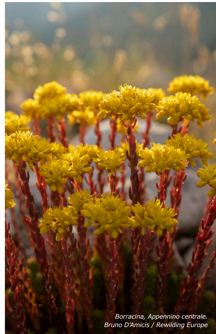
Borracina, Appennino centrale.

Per essere valido e opponibile a terzi, il contratto deve essere redatto per iscritto e trascritto alla competente Conservatoria del Registro Immobiliare. 17