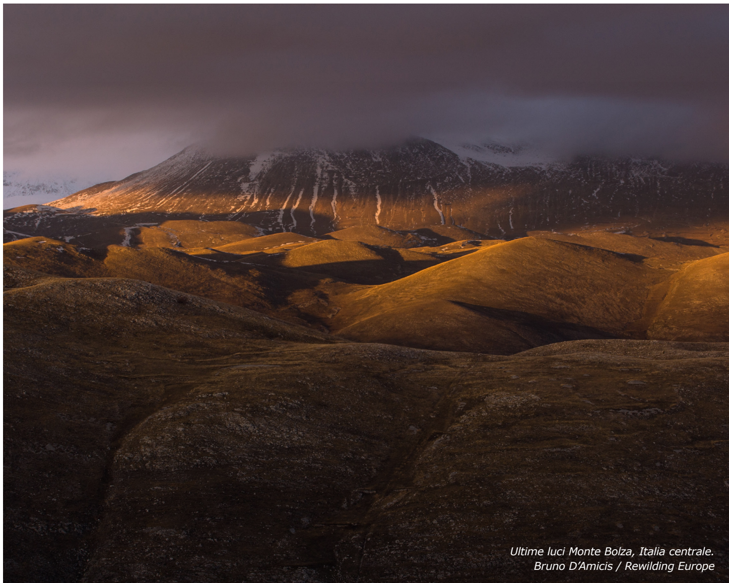
Ultime luci Monte Bolza, Italia centrale.

Questo principio può garantire un'ulteriore protezione costituzionale ai fini del rewilding , sebbene le disposizioni costituzionali non producano effetti immediati sull'ordinamento, ma piuttosto stabiliscano un insieme di valori posti a fondamento del medesimo.